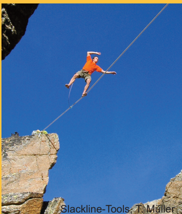
Slackline-Tools, T. Müller